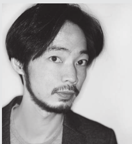
古城 隆 DADA CuBiC